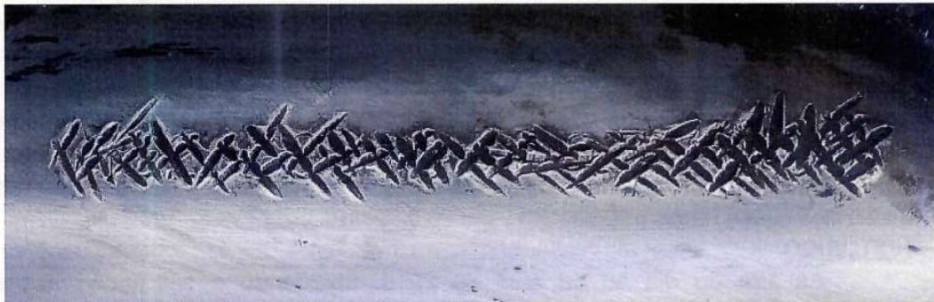
Fotografia ilustrativa 02 – Mostra detalhes da peça suporte e da gravação do NIV totalmente danificado por amolgaduras.

Após remoção da pintura no local específico e adjacências da gravação do NIV (Número de Identificação Veicular), foi observado e constatado pelos Peritos marcas de amolgaduras sobre a peça metálica suporte do NIV, mais precisamente sobre a sequência de caracteres originalmente gravada naquele local, danificado totalmente toda a sequência. Após tratamento mecânico/químico no local e com o auxílio de instrumentos óticos/fotográficos, foi possível visualizar apenas vestígios de uma codificação ali gravada, no entanto, devido aos danos, não foi possível identificá-la.