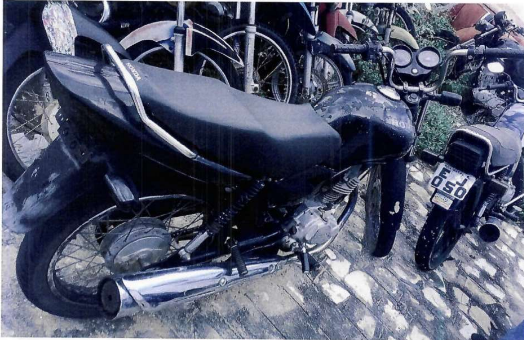
Fotografia ilustrativa 01 – Mostra uma visão geral do veículo.

Tratava-se de uma motocicleta da marca/modelo HONDA/CG125, cor predominante preta, que não ostentava a placa de matrícula.