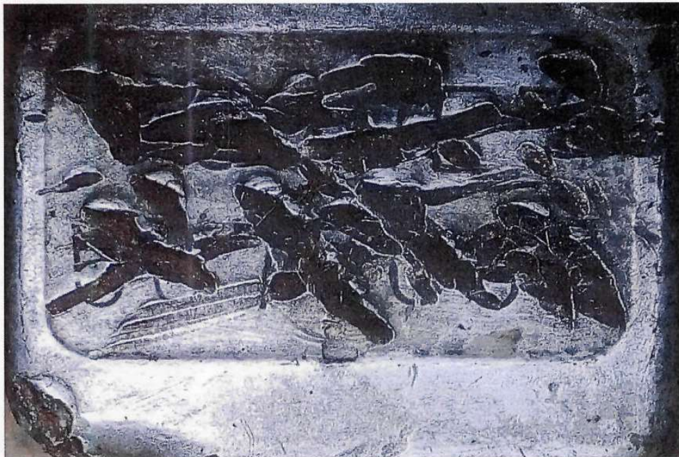
Fotografia ilustrativa 03 – Mostra detalhes da peça suporte e da codificação identificadora do motor totalmente danificada por amolgaduras.

Quanto à codificação identificadora do motor presente no veículo, da mesma forma que NIV, se apresentava danificada por amolgaduras. Após tratamento mecânico/químico no local foi possível visualizar apenas vestígios da codificação original gravada naquela peça, no entanto não foi possível identificar nenhum caractere.