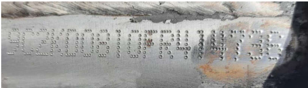
Fotografia ilustrativa 02 – Mostra detalhes da gravação do NIV remarcado artesanalmente.

Após remoção da pintura no local específico e adjacências da gravação da sequência alfanumérica identificadora do NIV (Número de Identificação Veicular), foi verificado que a superfície reservada à sua gravação apresentava desgaste na superfície metálica, bem como indícios de remarcação dos cinco últimos caracteres da sequência lá gravada (“9C2KD0810FR414736”). Isso posto, foi aplicado o devido reativo químico no local, e com o auxílio de instrumentos óticos e fotográficos, foram feitas análises sobre a superfície regravada do NIV, no entanto, devido aos danos e remarcações não foi possível visualizar e/ou identificar a gravação original.