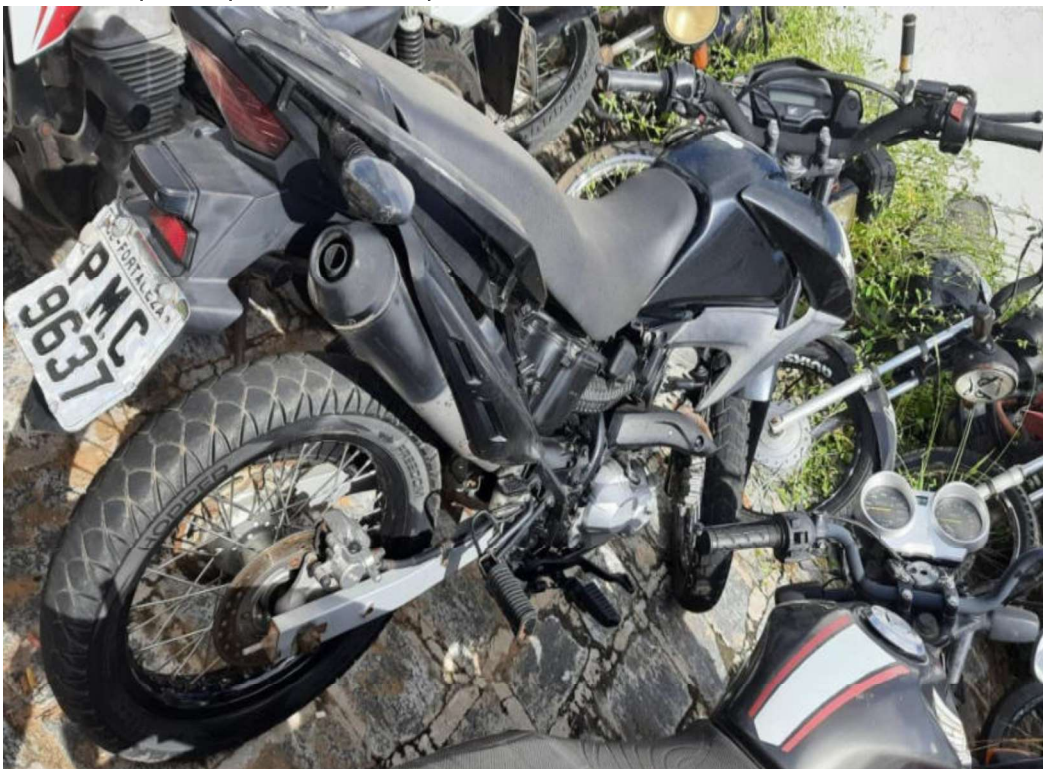
Fotografia ilustrativa 01 – Mostra uma visão geral do veículo.

Tratava-se de uma motocicleta da marca/modelo HONDA/NXR 160 BROS, cor preta, que ostentava a placa de matrícula PMC9637/CE.