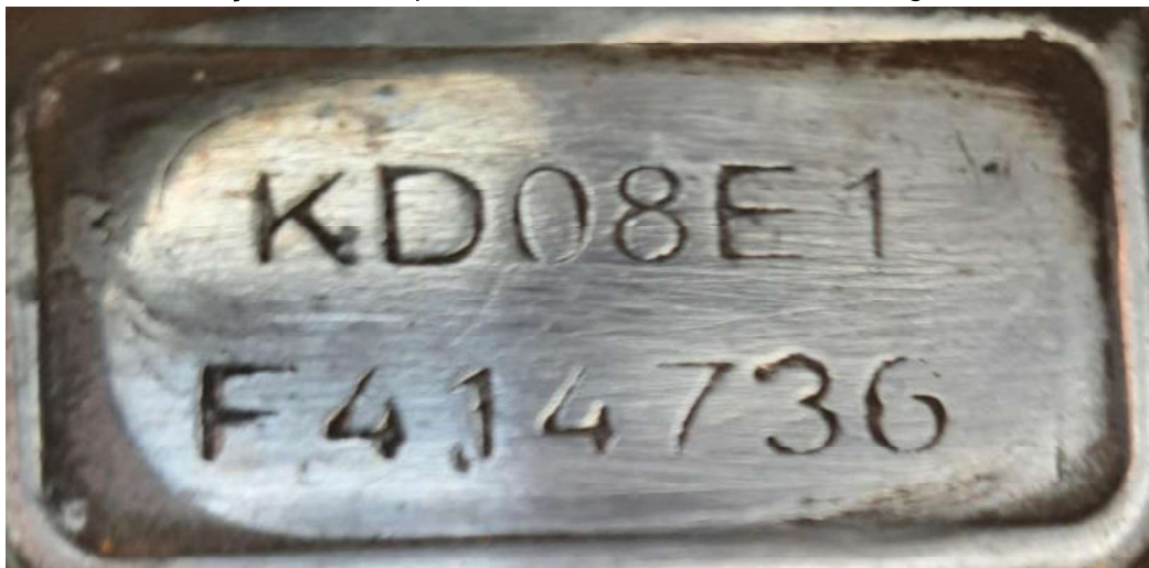
Fotografia ilustrativa 03 – Mostra detalhes da superfície onde normalmente é gravada a codificação identificadora do motor, bem como os caracteres totalmente remarcados artesanalmente.

Quanto à codificação identificadora do motor presente no veículo (KD08E1F414736), a mesma apresentava adulteração por remarcação dos caracteres da sequência alfanumérica. Após tratamento mecânico/químico no local, foram feitas análises sobre a superfície regravada do motor, no entanto, devido aos danos e remarcações, não foi possível identificar os caracteres originais.