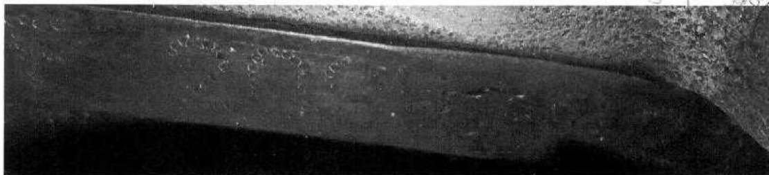
Fotografia ilustrativa de nº 04 – Mostra em detalhes parte da gravação adulterada da Sequência Alfanumérica Identificadora do motor observada no veículo.