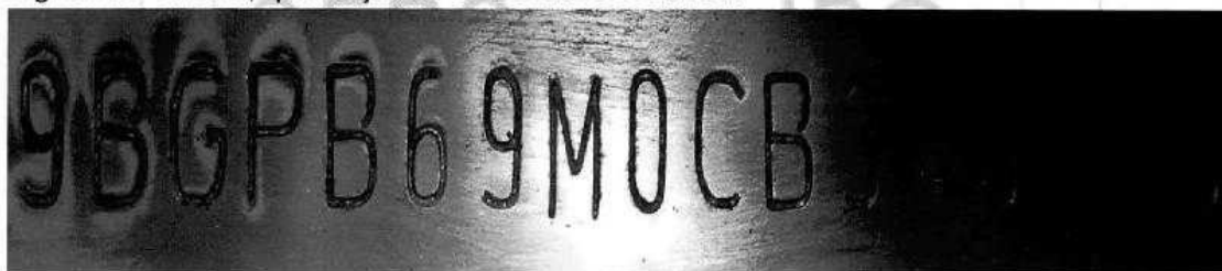
Fotografia ilustrativa de nº 02 – Mostra detalhes das gravações do NIV adulterado inicialmente observado no veículo.

Isto observado, a Equipe Pericial aplicou no verso da peça suporte do NIV reagente químico específico na tentativa de revelar o rebatimento dos caracteres originais apagados do NIV do veículo. Como dito, após a aplicação de reagente químico específico sobre o verso da superfície de gravação do NIV, foi possível revelar o rebatimento do NIV original do veículo, qual seja: 9BGPB69M0CB337005 .