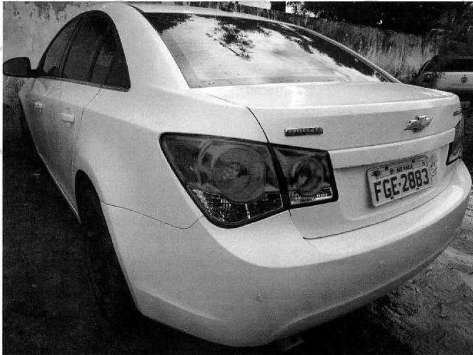
Fotografia ilustrativa de nº 01 – Mostra uma visão geral do veículo.

Tratava-se de um veículo automóvel da marca CHEVROLET, modelo CRUZE, cor branca, que apresentava placas de identificação FGE - 2883/SP.