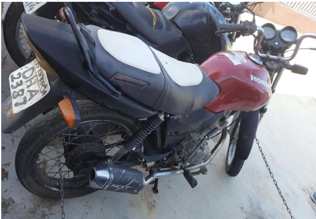
Fotografia ilustrativa 01 – Mostra uma visão geral do veículo.

Tratava-se de uma motocicleta da marca/modelo HONDA/CG 125 FAN, cor vermelha, que ostentava a placa de matrícula artesanal DHA2387.