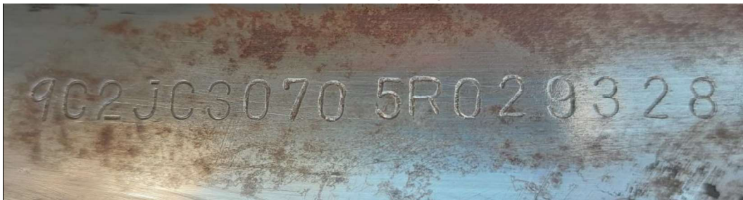
Fotografia ilustrativa 02 – Mostra detalhes da gravação do NIV remarcado artesanalmente.

Após remoção da pintura no local específico e adjacências da gravação da sequência alfanumérica identificadora do NIV (Número de Identificação Veicular), foi verificado que a superfície reservada à sua gravação apresentava desgaste na superfície metálica, bem como indícios de remarcação da sequência de caracteres lá gravada (9C2JC30705R029328). Isso posto, foi aplicado o devido reagente químico no local, e com o auxílio de instrumentos óticos e fotográficos, foram feitas análises sobre a superfície regravada do NIV, no entanto, devido aos danos e remarcações não foi possível visualizar e/ou identificar a gravação original.