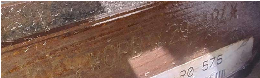
Imagem 4. Mostra detalhes da Sequência Alfanumérica Identificadora do motor presente.

A Sequência Alfanumérica Identificadora do Motor não apresentava vestígios de esmerilhamento e/ou outros vestígios de adulteração, constando a série seguinte *CPB 429 184*.