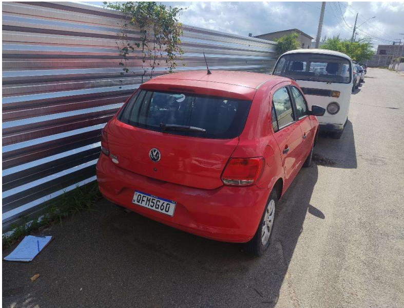
Imagem 1. Do veículo.